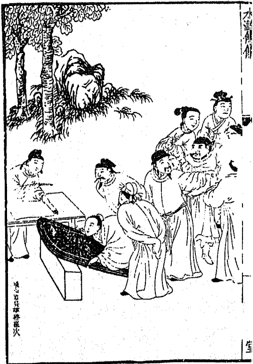
藥心石位學掛歷次